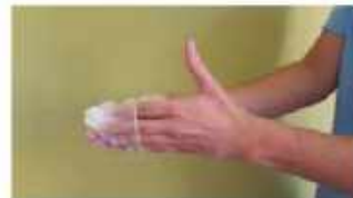
Retirar el guante sin tocar la parte externa del mismo