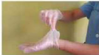
Pellizcar por el exterior del primer guante