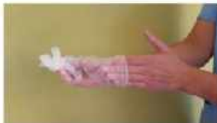
Retirar el segundo guante introduciendo los dedos por el interior