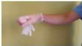
Recoger el primer guante con la otra mano