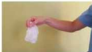
Retirar los dos guantes en el contenedor adecuado