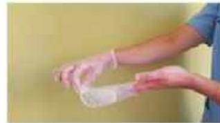
Retirar el guante en su totalidad