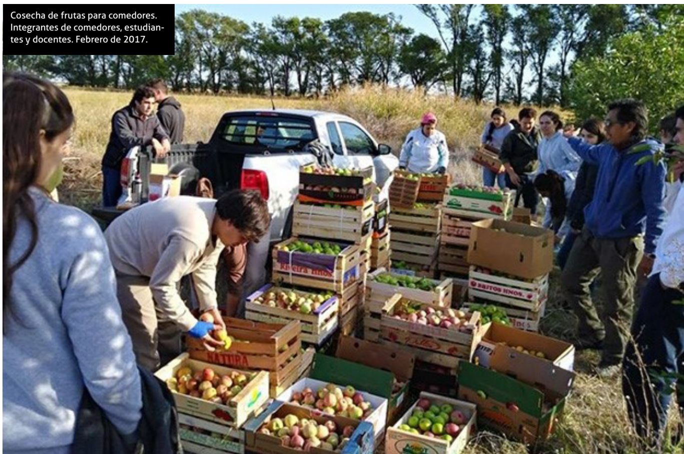
Cosecha de frutas para comedores. Integrantes de comedores, estudiantes y docentes. Febrero de 2017.

En breve se realizará una nueva cosecha de membrillos, peras y manzanas, que tendrá también un destino social y solidario, y a la que serán invitados las y los ingresantes 2019 de la Facultad de Agronomía. ■