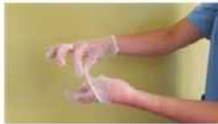
Retirar sin tocar la parte interior del guante